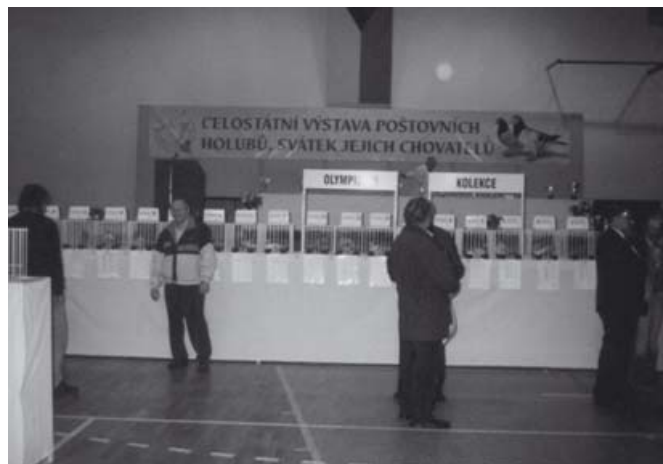
"CRACK OLYMPIAD" 03-CZ-0249-446 ♂