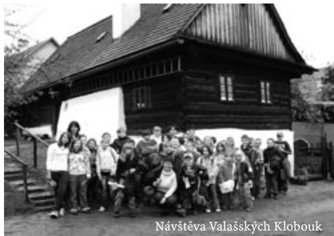
Návštěva Valašských Klobouk